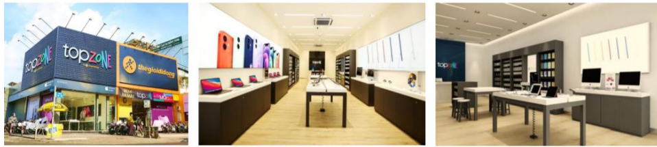
Phiên bản Topzone - Apple Authorized Reseller

Ngoài ra, mới đây, MWG cũng đã khai trương 4 cửa hàng đầu tiên thuộc chuỗi Topzone, mô hình chuyên cung cấp các sản phẩm công nghệ cao cấp của Apple và đặt mục tiêu đạt 50-60 vào cuối 1Q22. Theo chúng tôi, mặc dù đóng góp từ chuỗi này trong ngắn hạn, nhưng kỳ vọng sẽ là tiền đề để Công ty chiếm lĩnh phân khúc cao cấp với thương hiệu Apple, đặc biệt với xu hướng hãng có kế hoạch thúc đẩy sự phát triển của nhóm sản phẩm chính hãng tại Việt Nam thay cho phân khúc xách tay.