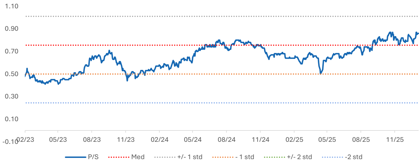
P/S của MWG trung vị 5 năm

Chúng tôi lựa chọn phương pháp P/S định giá cổ phiếu MWG, do doanh nghiệp hoạt động trong ngành bán lẻ đang trong giai đoạn mở rộng mạnh, với động lực tăng trưởng chủ yếu đến từ chuỗi Bách Hóa Xanh. Trong bối cảnh chi phí mở rộng, chi phí bán hàng và quản lý (SG&A) cũng như chi phí tài chính vẫn ở mức cao, các chỉ tiêu lợi nhuận hiện tại chưa phản ánh đầy đủ tiềm năng tăng trưởng của doanh nghiệp. Ngược lại, doanh thu là chỉ tiêu phù hợp hơn để phản ánh quy mô hoạt động và khả năng mở rộng thị phần của MWG, đặc biệt khi Bách Hóa Xanh bắt đầu có lãi và các chuỗi khác tiếp tục gia tăng số lượng cửa hàng và cải thiện doanh thu trên mỗi điểm bán. Với mức P/S mục tiêu là 1 lần, giá cổ phiếu mục tiêu của MWG theo phương pháp P/S là 100.000 VND/ cổ phiếu