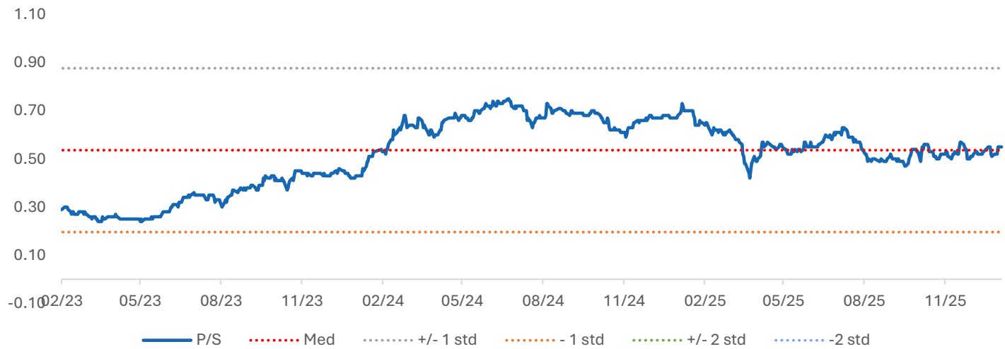
P/S của FRT trung vị 5 năm