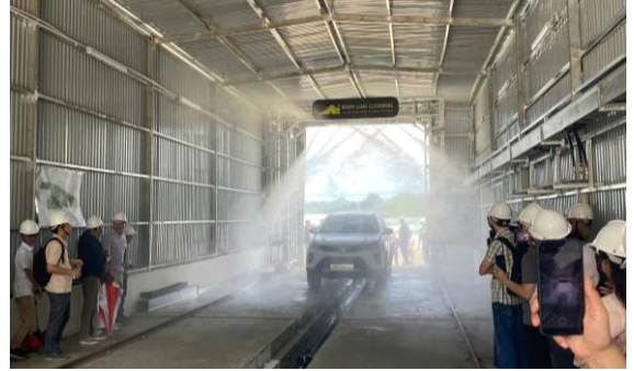
Hình 2: Khu khử trùng xe vận chuyển