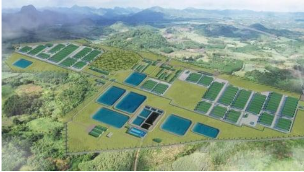
Hình 1: Phối cảnh dự án Giai Xuân