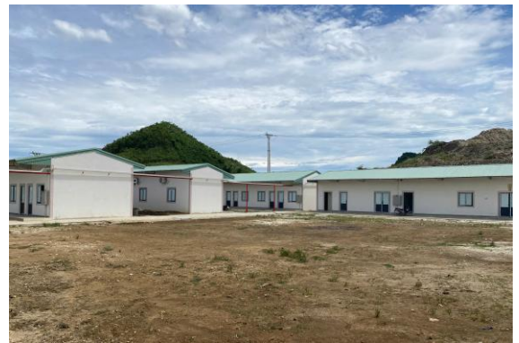
Hình 4: Khu nhà ở công nhân