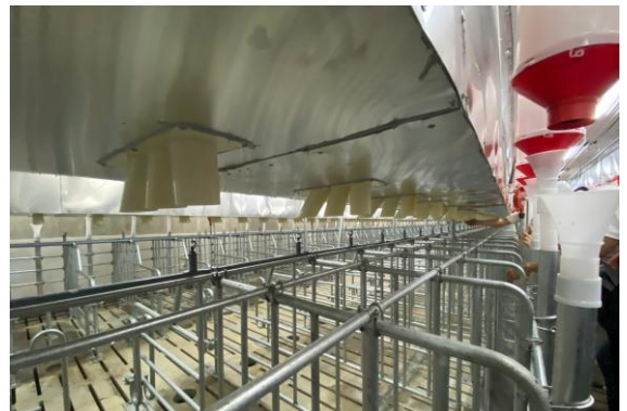
Hình 6: Chuồng nái hậu bị