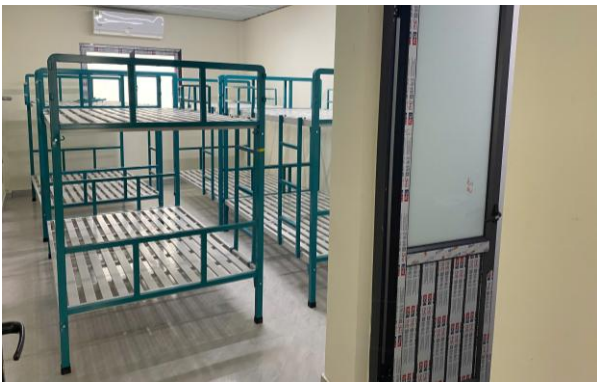
Hình 3: Khu nhà ở cách ly