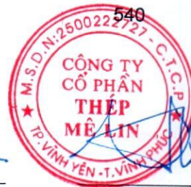
Tổng Giám đốc