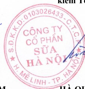
HÀ QUANG TUẤN