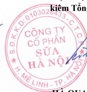
HÀ QUANG TUẤN