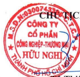
Tô Thiên Tân