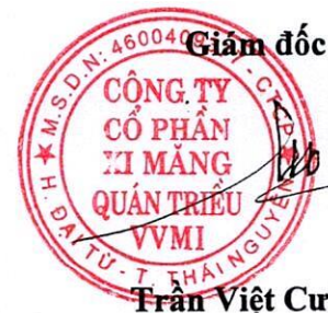
Trần Việt Cường