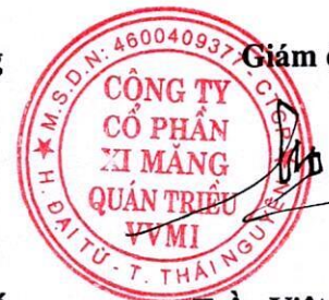
Trần Việt Cường