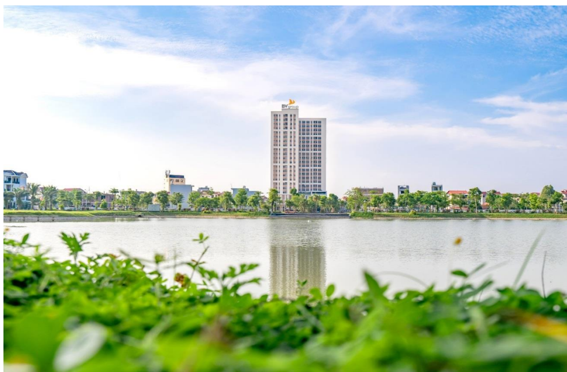
DỰ ÁN CHUNG CƯ BÁCH VIỆT ARECA GARDEN