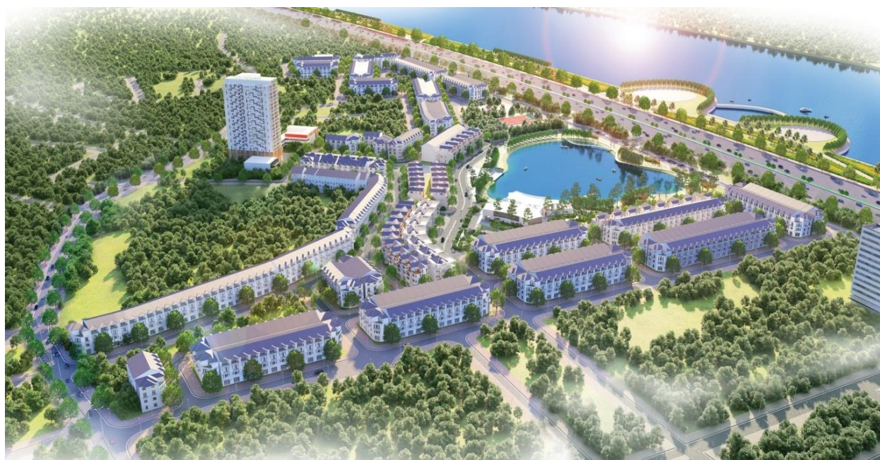
DỰ ÁN KHU ĐÔ THỊ MỚI BÁCH VIỆT LAKE GARDEN