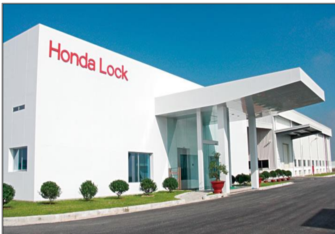
NHÀ MÁY HONDA LOCK VIETNAM