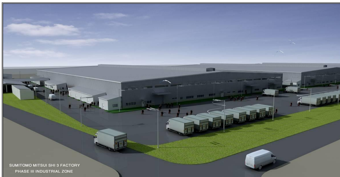
NHÀ MÁY SHI GIAI ĐOẠN III